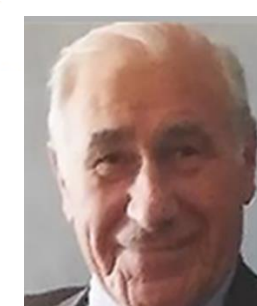
Jacques Bouvet Cercle E & S